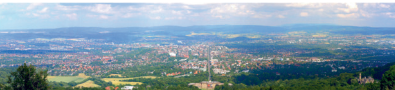
Blick auf Kassel vom Herkules aus